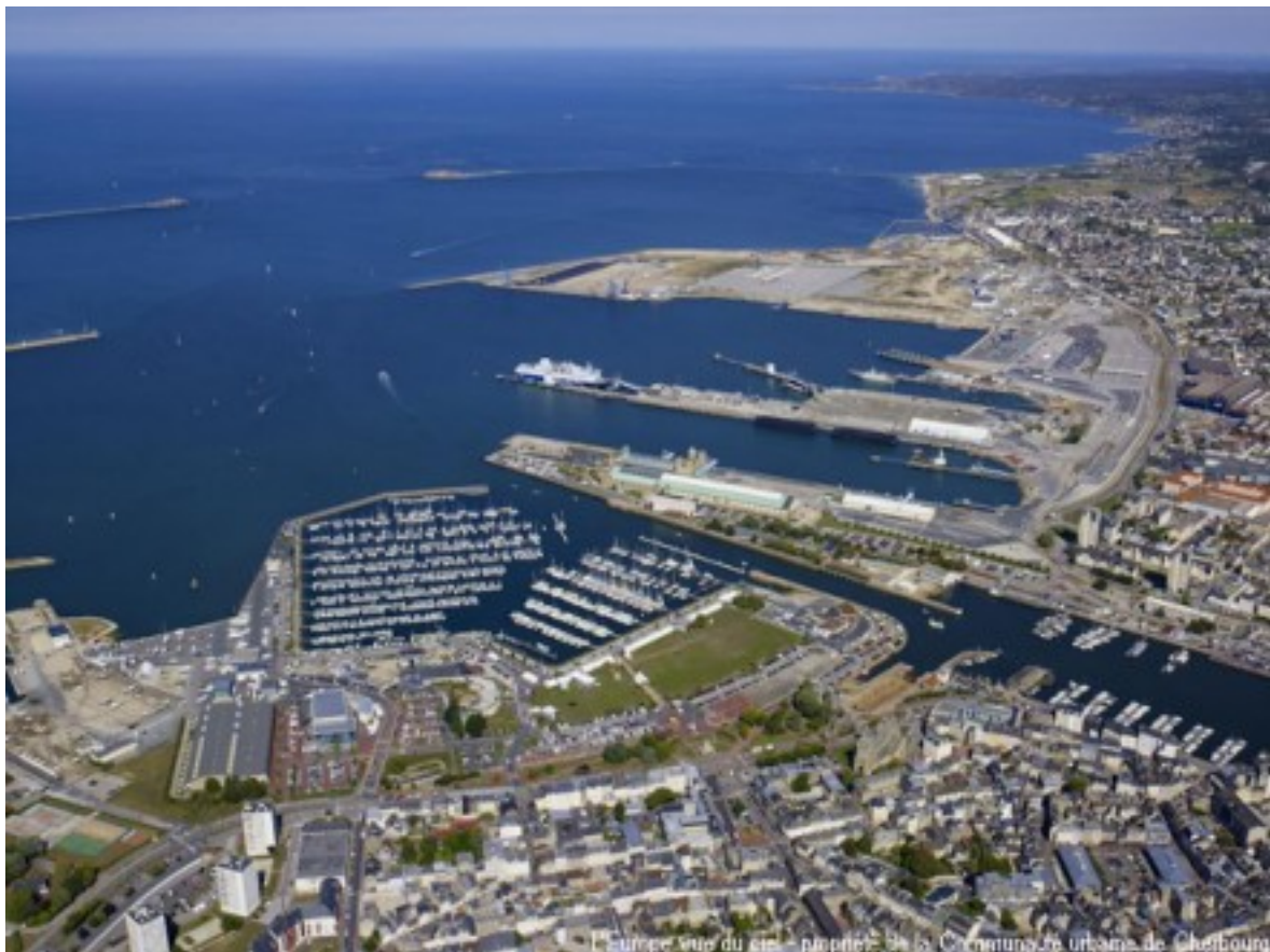
La nouvelle Gare maritime transatlantique de Cherbourg, inaugurée en 1933

L'Europe vue du ciel - propriété de la Commission urbaine de Cherbourg