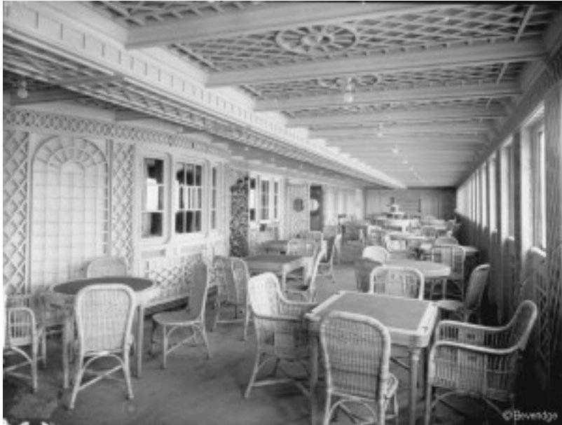
Le Café Parisien

Titanic était prévu, pour séduire les plus hautes strates de la société.