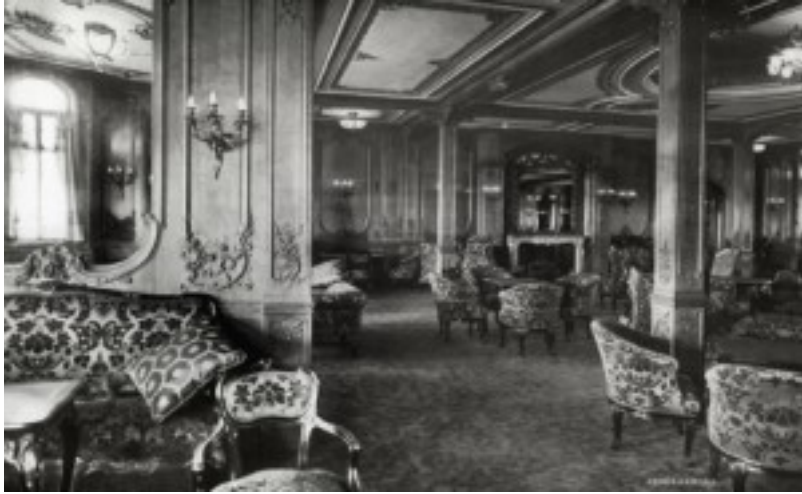
Le Salon 1re classe