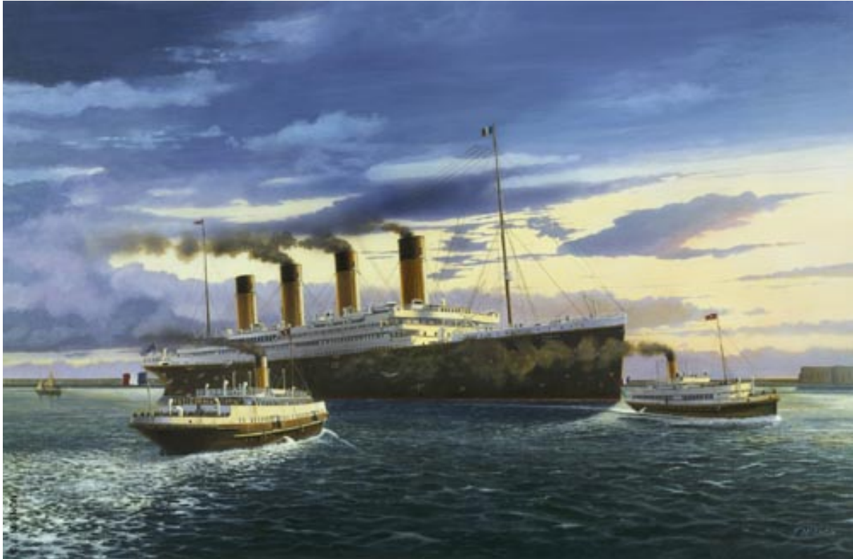
Le Titanic dans la rade de Cherbourg