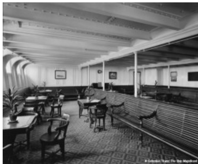
Espace 3e classe

Les 3es classe (706) sont le plus souvent des émigrants partis chercher fortune dans le Nouveau Monde. Sur le paquebot Titanic , ils voyagent dans de meilleures conditions que sur la plupart des autres transports maritimes. Bien que cantonnés dans les parties basses du navire, ils logent dans des compartiments de 4 à 6 couchettes (au lieu des dortoirs traditionnels) et disposent d'une salle à manger où leur sont servis 3 repas par jour (sur les autres bateaux, ils doivent emmener leur nourriture). Ils disposent également d'un salon et d'un fumoir. La construction du Titanic était donc pensée pour offrir le confort à toutes les couches sociales.